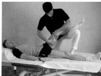
Masaje de movilización articular

Si aparecen zonas del tejido conjuntivo cerca de las fascias y con trastornos musculares e incluso articulares, puede combinarse el Masaje del tejido conjuntivo con el Masaje de movilización articular y ejercicios activos isométricos.