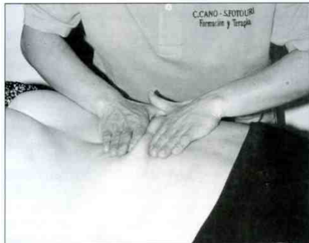
Manipulación de aserrar, levantando cada uno de los dermatomas en la zona retroventral.